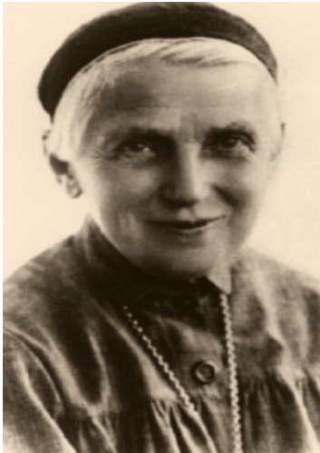
ŚW. URSZULA LEDÓCHOWSKA 1865 – 1939

Julia Ledóchowska urodziła się 17 IV 1865 w Loosdorf (Austria). W 1883 rodzina przeniósła się do Lipnicy Murowanej, niedaleko Krakowa. W 1886 Julia wstąpiła do klasztoru urszulanek w Krakowie. Tu, już jako m. Urszula, zajęła się przede wszystkim pracą pedagogiczną.